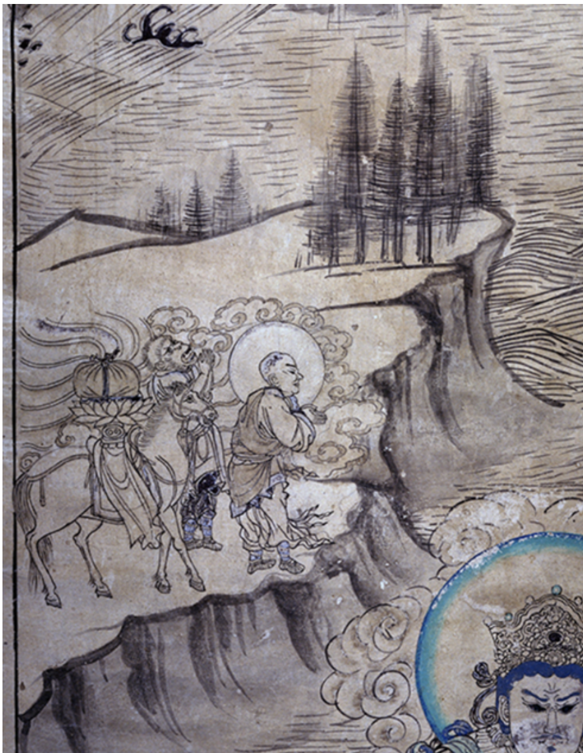
榆林窟第3窟 迄今为止发现时代最早的《玄奘取经图》

玄奘深入研究于阗以及西域诸国的地理交通、风俗物产和当地的佛教演变，特别是于阗祖先起源、蚕种西传两则传说的保存以及毗沙门天信仰的内地传播，为中原与西域的民族融合、文化交流、技术共享以及宗教交融开辟了新渠道，拓展了新视角，不仅加深了对唐代西域佛教文化的了解，也极大的推动佛教的中国化进程。