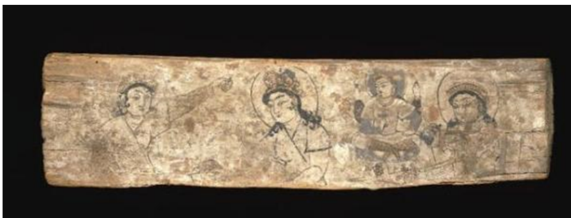
丹丹乌里克遗址的蚕种西传木板画（

“发明养蚕和制作丝绸的技艺，是古代中国对于人类文明的一大贡献。”于阗处于中国陆上丝绸之路的重要节点，但是玄奘在《大唐西域记》中介绍于阗的桑蚕业是一位“东国”公主下嫁时将蚕种藏在帽子里带到于阗的，《新唐书》中也有相似记载，但均未说明“东国”所在何处，但追根溯源的话，“这个国家指的一定是今天中国的中原地区。”丹丹乌里克遗址板画上的蚕茧、织机等养蚕缫丝纺织工具必然也与中国养殖和手工业相关。这个传说展现了我国丝绸生产技术的独特优势，也强调了中原与西域技术交流的重要性。技术的传播不仅促进了商品贸易和经济发展，更重要的是借此增进了中原地区与西域地区之间的文化交流，还有助于促进中国与世界的经济联系。